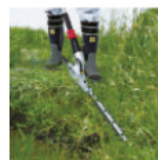
Recortadora de suelo EN420MP EN421MP