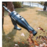
Sopladora UB400MP UB401MP