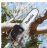
Sierra de altura EY401MP EY402MP EY403MP