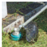
Desbrozadora EM401MP* / EM402MP EM403MP* / EM404MP* EM405MP* / EM406MP*