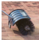
Cepillo barreador BR400MP