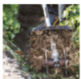
Cultivador KR400MP KR401MP