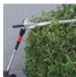
Cortasetos Derecha: EN410MP Ajuste de ángulo: EN400MP EN401MP EN403MP