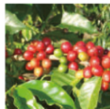
Cosechadora de café EJ400MP