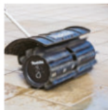
Cepillo Metalico SW400MP