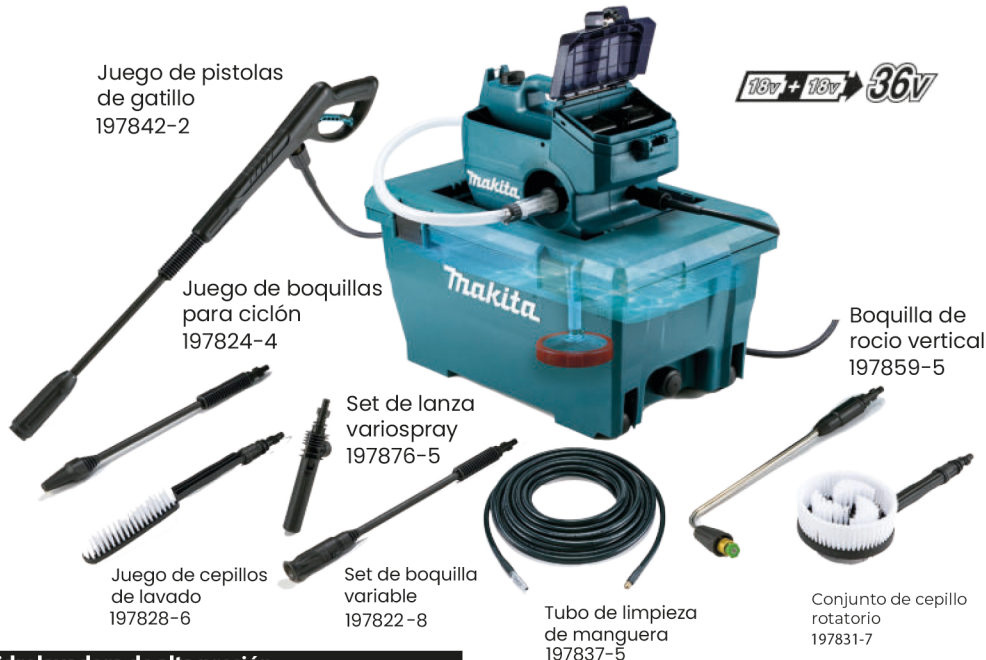
Juego de pistolas de gatillo 197842-2

No requiere toma corriente, No requiere fuente de agua Ideal para carros, paredes, escalones, etc. Se puede limpiar en cualquier lugar y ha cualquier hora.